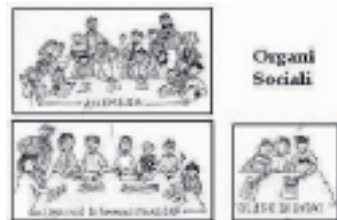
GRUPPO In alto a sinistra il gruppo creativo. Qui sopra e accanto le vignette realizzate dagli studenti della scuola media

mentalità imprenditoriale, senza tuttavia dimenticare che la risorsa centrale è l'uomo».